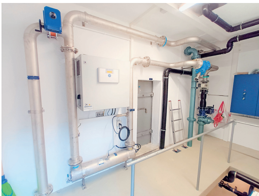
Rohrkeller EG Reservoir Grosswis

Wasserkorporation Pfäfers Der Verwaltungsrat