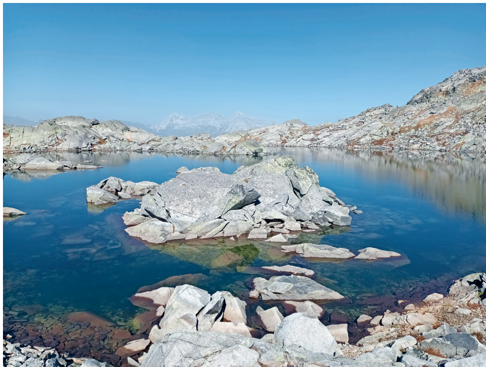
Lago Azzuro, Splügenpass